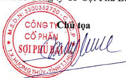
Ông: BUI NGUYEN TIEN